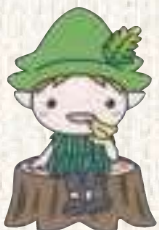
森林植物園マスコットキャラクター モリンくん

面積 約142ha 標高 約450m (森林展示館前広場) 約410m (長谷池周辺)